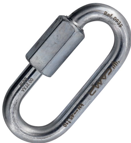
Oval Quick Link Steel 0934 Ø 8 mm

Maglie rapide ovali per connessioni fisse ad alta resistenza.