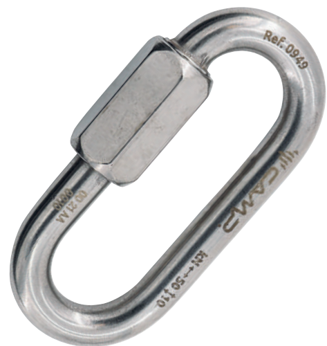
Oval Quick Link Stainless 0939 Ø 8 mm

In acciaio inossidabile AISI 316, per installazioni esterne o in ambienti corrosivi.