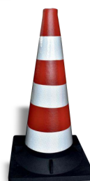
H 54 b