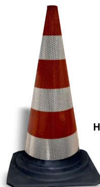
H 78 a