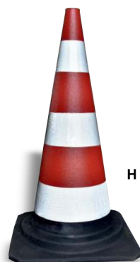
H 78 b

Posare sulla pavimentazione la base quadrata del cono. Per il corretto utilizzo fare riferimento al Codice della Strada (art.21), al Regolamento di Esecuzione ed Attuazione (DPR 16.12.92, n. 495, art.34) e al Disciplinare tecnico per il segnalamento temporaneo, D.M. 10/07/2002.