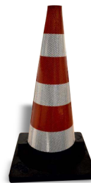
H 54 a